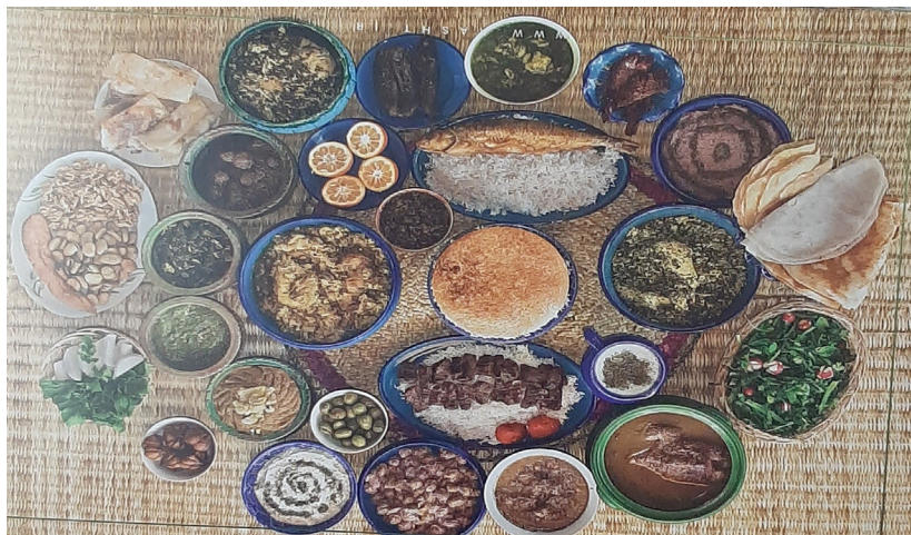
شنا کوچک پور پایه پنجم

رشت، یکی از شهرهای بسیار بزرگ ایران است. شهر رشت به خاطر همسایگی اش با دریای خزر، آب و هوای معتدل خزری دارد. شهری بسیار سرسبز است که در مرکز استان گیلان واقع شده است مردم رشت به زبان گیلکی صحبت می کنند رشت انواع واقسام بازارهای مختلف و مراکز خرید کوچک و بزرگ دارد در برخی مناطق این شهر، خصوصاً در روستاها، زنان گیلکی لباس سنتی با دامن های چین دار و رنگارنگ به همراه جلیقه و روسری می پوشند سوغاتی این شهر شامل انواع واقسام تولیدات سنتی، محصولات خوراکی تازه، انواع ترشیجات، زیتون، ماهی شور، کلوچه های سنتی، شیرینی های مختلف، صنایع دستی ساخته شده از چوب و بسیاری از وسایل دیگر می باشد معروف ترین غذاهای رشت عبارتند از: کال کباب، انواع ماهی، ترش تره، اشپل کوکو، اناربیج، باقلاقاتق، سیرقلیه، واویشکا، شامی رشتی و یک عالمه غذاهای خوشمزه ی دیگر است رشت جاذبه های گردشگری زیادی دارد از جمله: میدان شهرداری رشت، آرامگاه میرزا کوچک خان جنگلی، پارک جنگلی سراوان، بازار رشت، پارک ملت رشت و خیلی جاهای دیدنی دیگری دارد